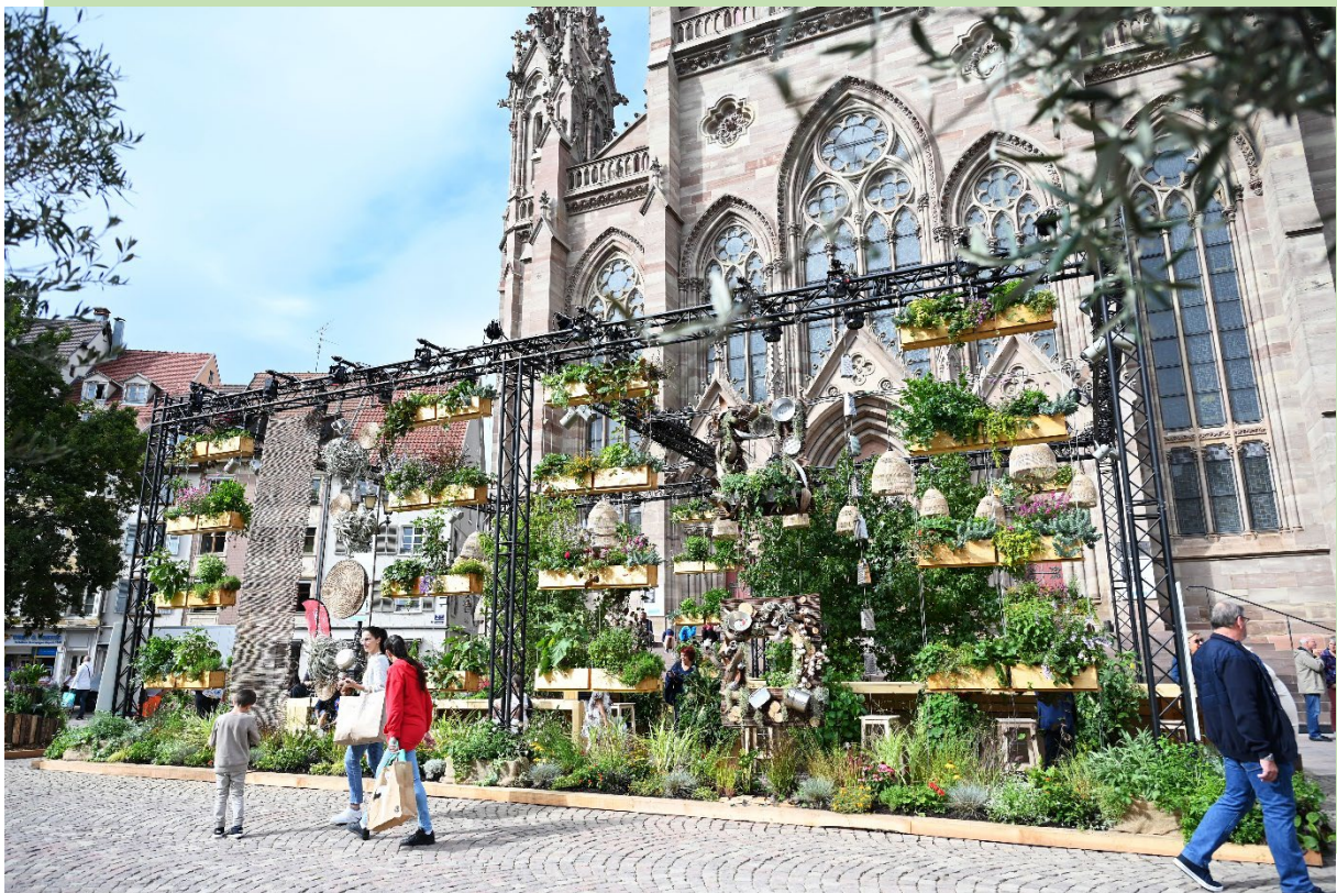
Le jardin éphémère 2023

Un temps inaugural a lieu ce samedi 31 août, à 14h30, pour présenter ce jardin qui offre un clin d'œil aux 800 ans de la Ville de Mulhouse. Le public peut arpenter ce jardin éphémère à partir du 29 août jusqu'au 18 septembre.