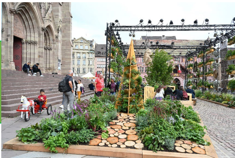
Le jardin éphémère 2023

Les deux roues de Mulhouse et les trois arches en osier seront réemployées sur Folie'Flore, puis, devraient refaire leur apparition dans les décors du marché de Noël.