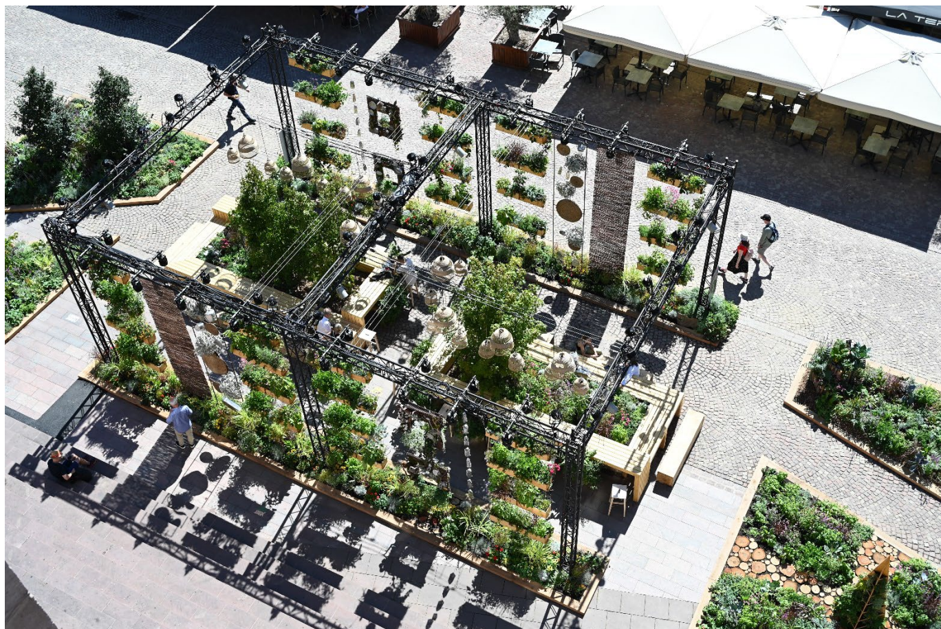
Le jardin éphémère 2023