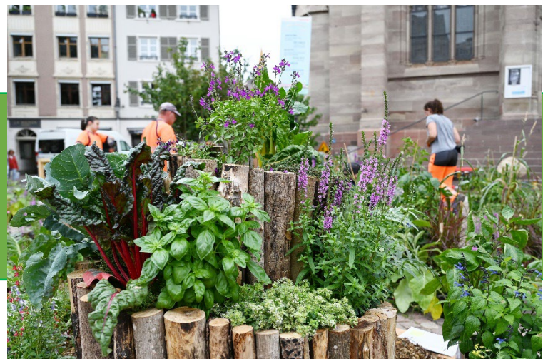
Le jardin éphémère 2023