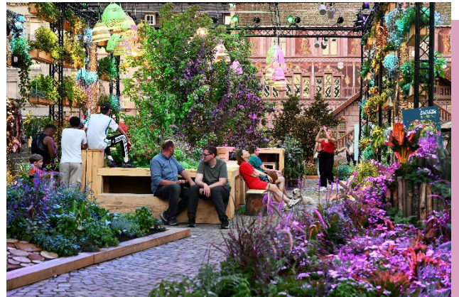
Le jardin éphémère 2023

Ce jardin renvoie à la fois par son côté rustique, au passé et à l'origine de Mulhouse et par la notion de nature en ville, au futur de la ville et au bien-être que cette nature peut apporter aux Mulhousiens.