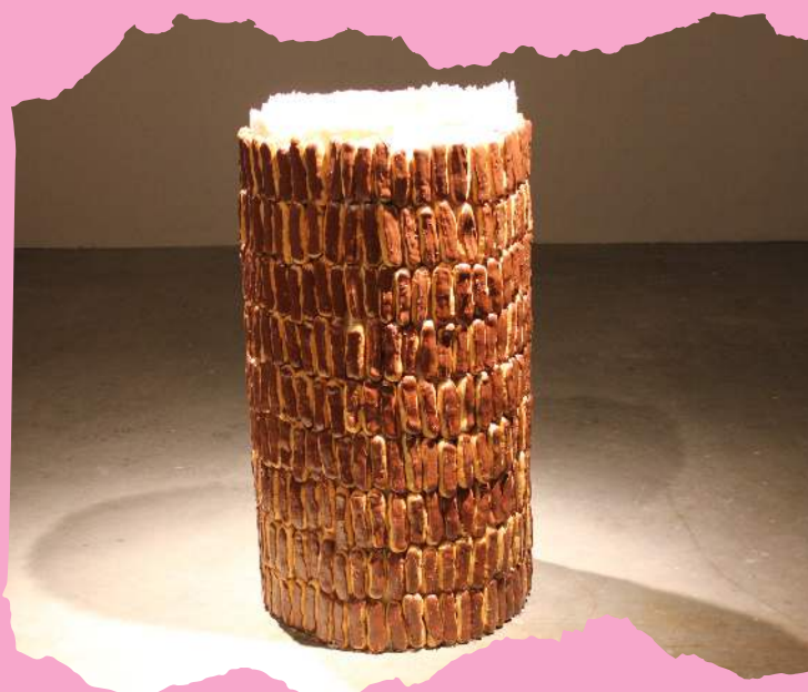
Colonne sans faim I, 2013, sucre et 500 éclairs au chocolat, 120 cm Florent Poussineau

L'installation spécialement conçue pour l'inauguration de la biennale de la jeune création de Mulhouse fait référence au passé industriel et textile du bâtiment qui accueille la manifestation. Les mets culinaires sont positionnés sur des cylindres symbolisant des bobines en mouvement. Les convives sont invités à faire évoluer cette installation.