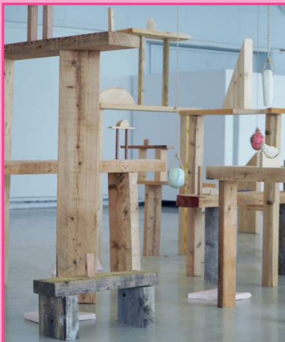
everything in its place , Mathilde chéreau, 2021