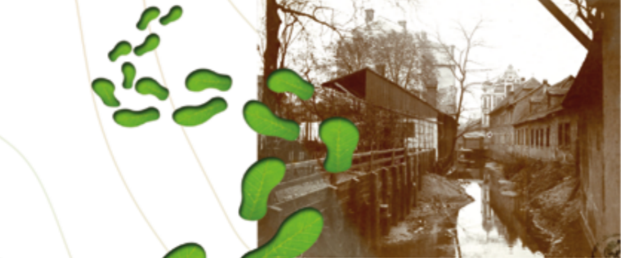
Canal du Walkenbach près de l'église Sainte-Marie à la fin du 19 ème siècle