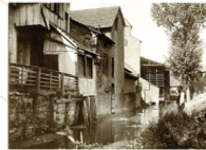
Le Traenkbach entre Bollwerk et porte Jeune

Tu suis maintenant le cours des anciens canaux. Il y avait autrefois une tannerie et plusieurs moulins entre la tour du Bollwerk et la porte Jeune* sur le Traenkbach. Le dernier meunier cessa son activité en 1898.