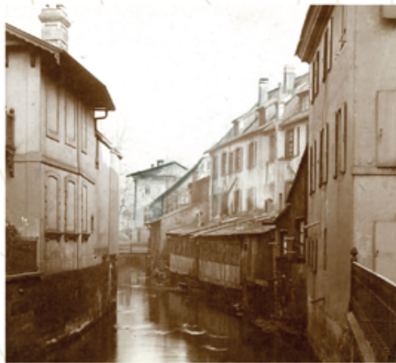
Le Traenkbach près de la Porte Haute

La photo ci-dessus te montre ce que tu aurais pu voir à la fin du 19 ème siècle (l'arrière des maisons se situaient dans l'impasse que tu viens d'emprunter).