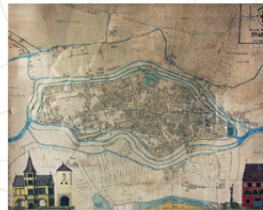
Mulhouse entourée de ses canaux en 1797

Les canaux avaient tous un nom. Au nord, ce sont : le Traenkbach, le Walkenbach et le Dollergraben. Au sud, il s'agit du Traenkbach, du Mittelbach, du Karpfenbach et de la Sinne.