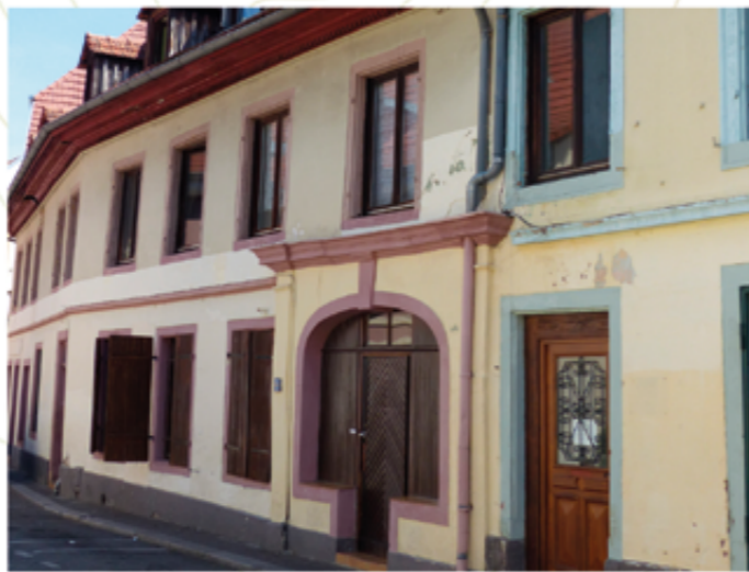
Première manufacture textile

Cette rue a une grande importance dans l'histoire de Mulhouse car c'est dans celle-ci que trois jeunes Mulhousiens, accompagnés d'un banquier d'origine suisse, fondent la première manufacture de toiles peintes en 1746. Pour cela, ils achètent successivement les maisons se situant aux n° 2, 4 et 6.