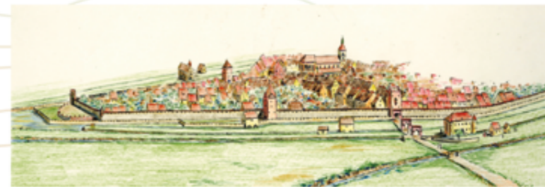
Dessin représentant le système de défense de la ville vers 1600