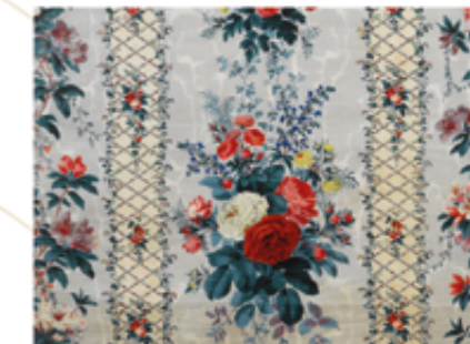
Tissu Second Empire

Tu passes devant le musée de l'Impression sur Etoffes, dont le bâtiment est construit par la Société Industrielle en 1883. Le musée conserve une importante collection de tissus. La nature y tient une place importante, servant de modèle pour la création de motifs : fleurs et feuilles y abondent à toutes les époques.