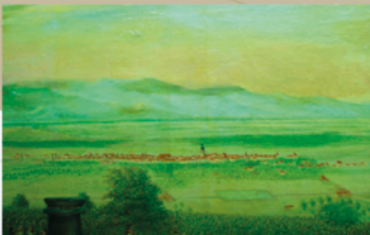
Mulhouse dans son environnement naturel au début 19 ème siècle