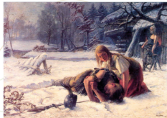
Peinture représentant la légende de Mulhouse