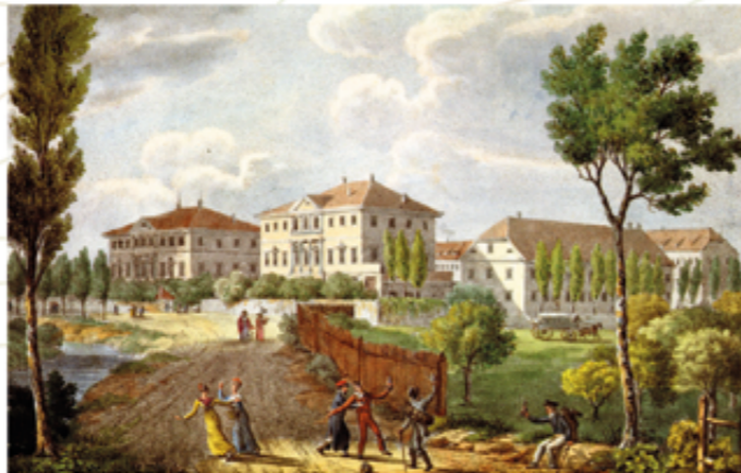
La manufacture Hofer en 1825

C'est ici que s'achève ton périple dans la Mulhouse verte et bleue !