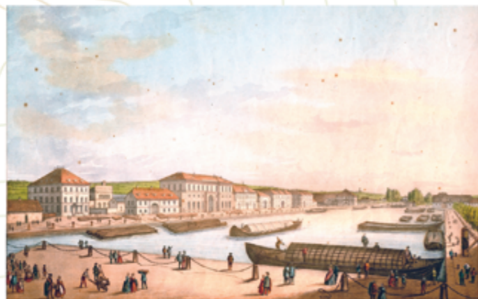
Vue du bassin vers 1840

Te voici devant ce qui était le bassin de chargement et de déchargement des marchandises. Son succès est tel qu'il faut l'agrandir dès 1837. Malgré tout, trop petit, il est délaissé en 1876 au profit du Nouveau Bassin qui est créé à l'est de la ville. Il change alors de vocation.