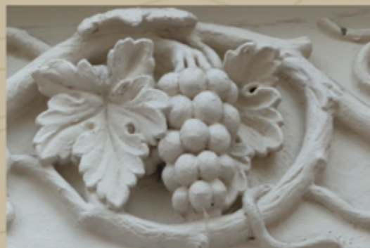
La nature sculptée