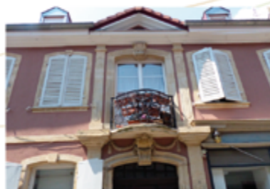
5 rue de la Loi

Avant de poursuivre ton périple, tu pourras jeter un coup d'œil à l'élégante maison de maître qui se trouve au n°5. Construite dans les années 1760, il s'agit très certainement de la demeure de l'un des fondateurs de la manufacture située en face.