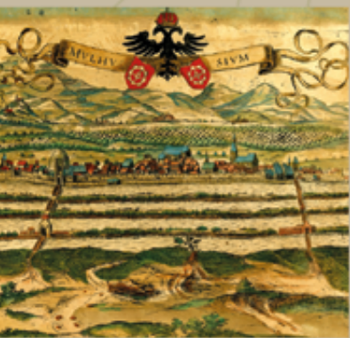
Vue de Mulhouse entourée de ses canaux au 17 ème siècle

Mulhouse a toujours entretenu de forts rapports avec la nature. D'ailleurs, selon une belle légende, tout n'aurait-il pas commencé avec l'eau ?