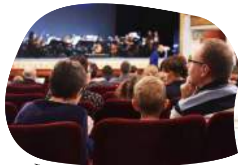
Théâtre de la Sinne

Du théâtre pour les parents et pour les enfants! Ils proposent une programmation joyeuse et rayonnante à La Filature et au Théâtre de la Sinne.