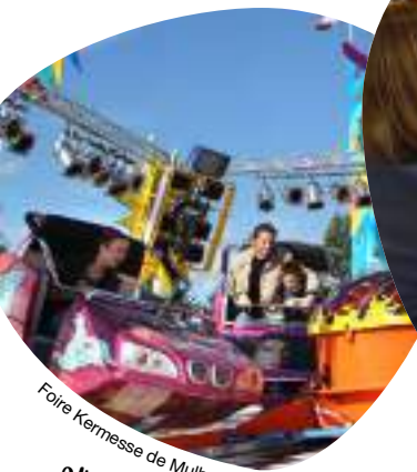
Foire Kermesse de Mulhouse