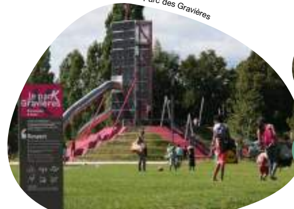
Parc des Gravières