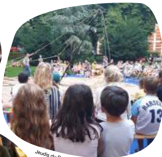
Jeudis du Parc à Mulhouse

Retrouvez tout le programme des événements sur mulhouse.fr et sur tourisme-mulhouse.com