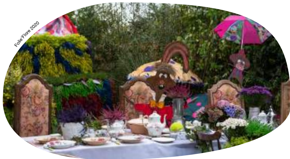
Folie Flore 2020

De nombreuses manifestations sont adaptées aux familles.