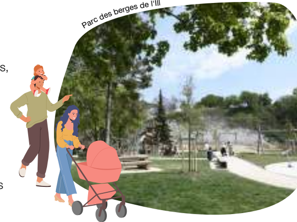
Parc des berges de l'III