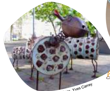
Les moutons. Yves Carrey

Les livrets des circuits sont disponibles sur: tourisme-mulhouse.com/experiences/circuits-decouvertes-mulhouse/ ou à retirer à l'Office de Tourisme. Retrouvez ces circuits également sur l'application Cirkwi.