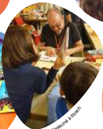
Bédéciné à Illzach