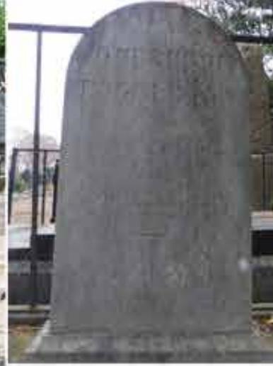
Monument Godefroi Engelmann

Le premier cimetière se situe place de la Réunion, près de l'église Saint-Etienne. Il s'agit alors d'assurer son salut par la proximité d'un lieu de prière. A partir de 1533, avec le passage à la Réforme, et jusqu'en 1803, les morts sont enterrés près de l'église Sainte-Marie désacralisée. L'augmentation de la population et les thèses hygiénistes qui privilégient les nécropoles extra-muros induisent l'ouverture d'un nouveau cimetière pour Catholiques et Protestants – les Israélites ont le leur en 1831- à l'emplacement de l'actuel parc Salvator. Plusieurs fois agrandi, il devient néanmoins trop petit et rattrapé par