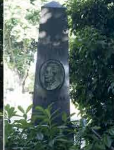
Monument Auguste Lustig