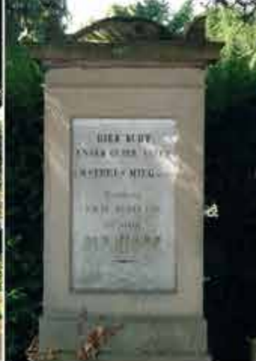
Monument Mathieu Mieg