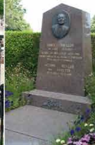
Monument Emile Muller