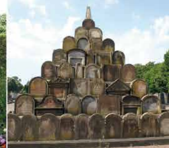
Monument du souvenir