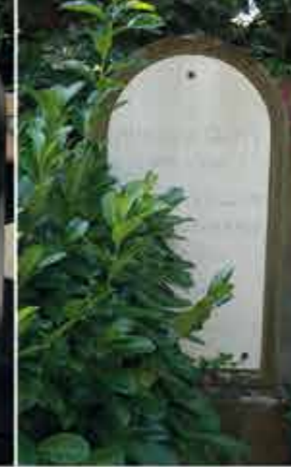
Monument de Glehn