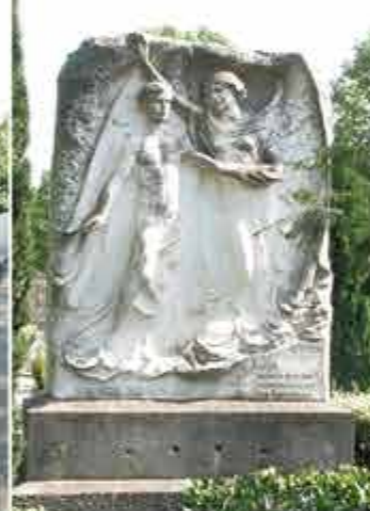
Monument Lucien Cabossel