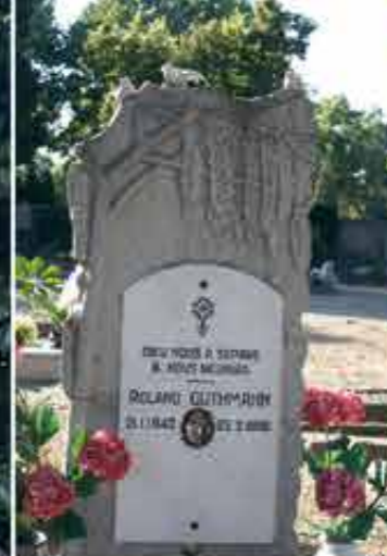
Monument Roland Guthmann