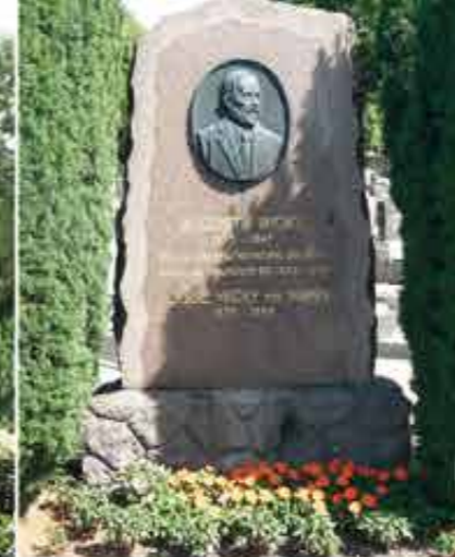
Monument Auguste Wicky