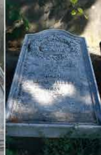
Monument Nicolas Koechlin