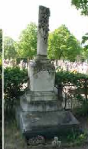
Monument Gaston Meyer