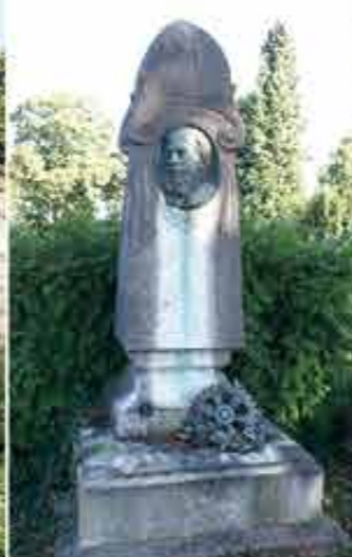
Monument Emile Hubner