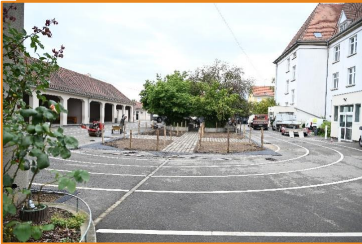
Eté 2023 - Ecole Stintz

Deux cours d'écoles résilientes ont été aménagées cet été : les écoles élémentaires Wolf et Stintz. 3 nouvelles cours d'école sont programmées pour cette année.