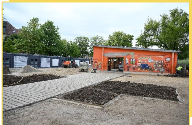
Eté 2023 - Ecole Wolf