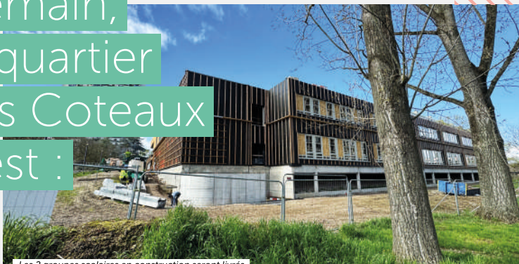
Les 2 groupes scolaires en construction seront livrés entre fin 2024 et début 2025.