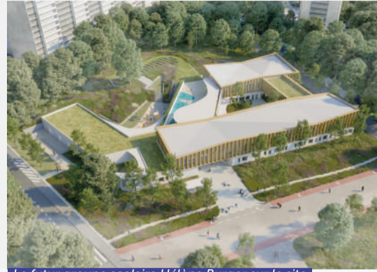
Le futur groupe scolaire Hélène Burger sur le site de l'actuelle école Henri Matisse. Réalisation : 2025-2027