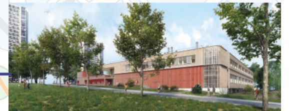
Le groupe scolaire Simone Veil, rue Pierre Loti, en cours de construction. Réalisation : 2022-2024