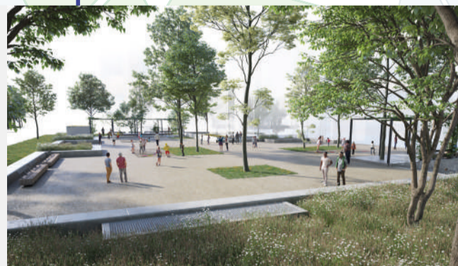
Le bailleur 3F Grand Est végétalise les anciennes dalles au-dessus des parkings. Réalisation : 2023-2024