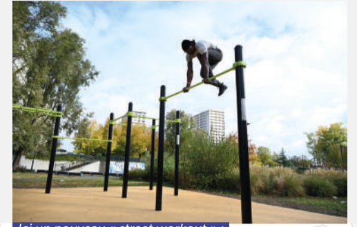
Ici un nouveau « street workout » : des agrès en extérieur à la disposition de tous. Réalisation : 2023