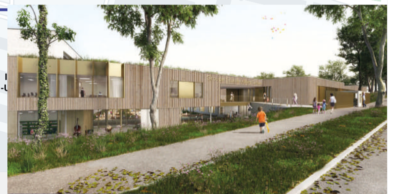
Le groupe scolaire Claire Roman, rue Jules Verne, en cours de construction. Réalisation : 2022-2024