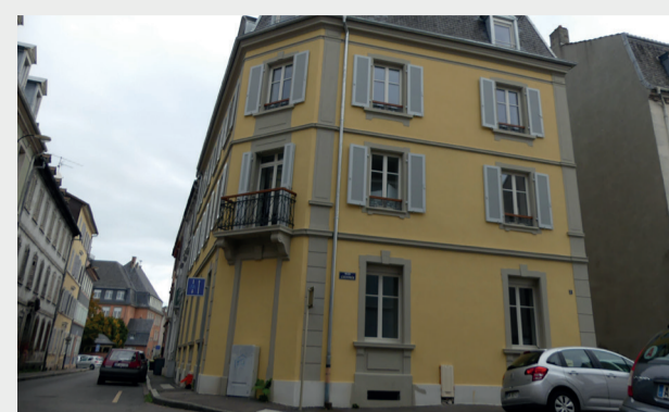
L'exemple d'un beau bâtiment entièrement rénové grâce aux aides de l'Opah : ravalement des façades, réaménagement des 8 logements, réfection des salles de bain et de l'électricité, remplacement des menuiseries, isolation des murs, planchers et combles, etc.