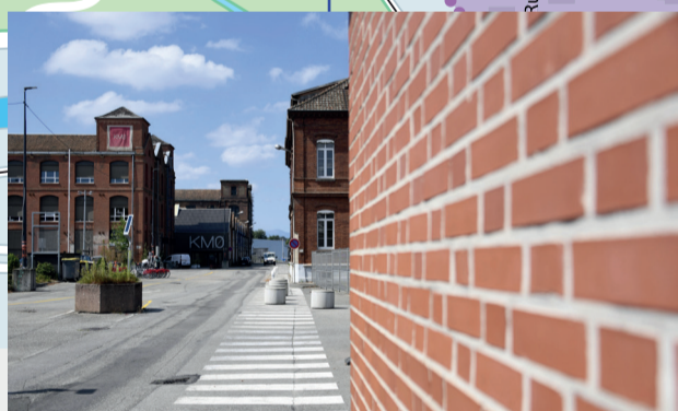
Le Village industriel Fonderie c'est la réappropriation des anciens bâtiments de la SACM. Outre la société MEA (groupe Mitsubishi) et KM0 (lieu d'innovation et de formation autour du numérique), de nouvelles activités vont s'installer. Par exemple : le Fablab de Technistub (un atelier-laboratoire associatif ouvert à tous) et le Quatrium du Cetim Grand Est (centre de test pour l'accélération numérique des industriels).