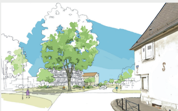
L'ouverture du Village industriel Fonderie vers le nord du quartier débouchera sur la rue Gay-Lussac avec, à l'entrée, un parking en silo de 400 places environ. (Vue ici depuis la rue de la Tour du Diable)

A l'horizon 2030, le quartier Fonderie se transforme