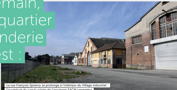
La rue François Spoerry se prolonge à l'intérieur du Village industriel : l'ouverture du canal usinier de l'ancienne SACM permettra une promenade au bord de l'eau à travers ce nouveau quartier.