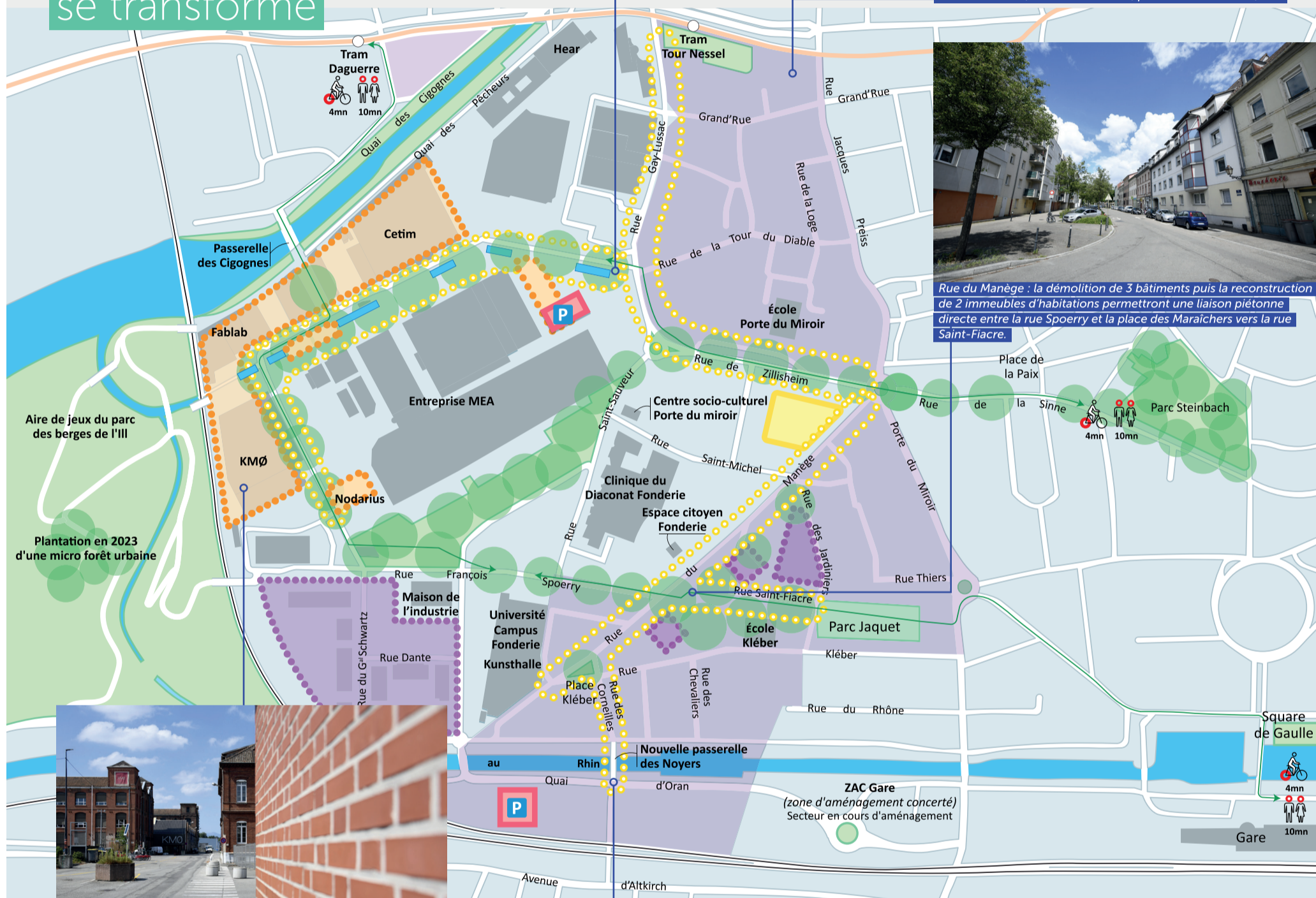
Rue du Manège : la démolition de 3 bâtiments puis la reconstruction de 2 immeubles d'habitations permettront une liaison piétonne directe entre la rue Sperry et la place des Maraîchers vers la rue Saint-Fiacre.