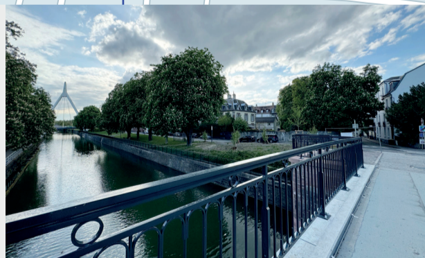
La passerelle des Noyers a été entièrement rénovée pour faciliter les mobilités douces.