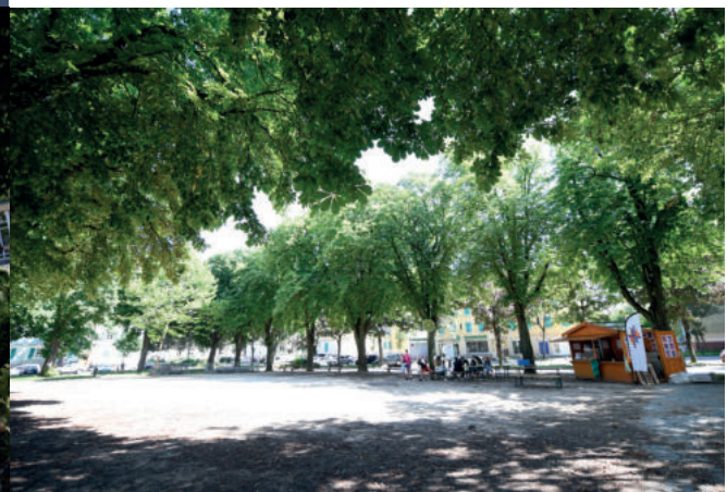
Au Drouot : la place Hauger est repensée pour un meilleur partage des usages, les espaces publics sont réaménagés, m2A Habitat réhabilite plus de 800 logements, une nouvelle entrée de ville est créée en lieu et place du Nouveau Drouot...