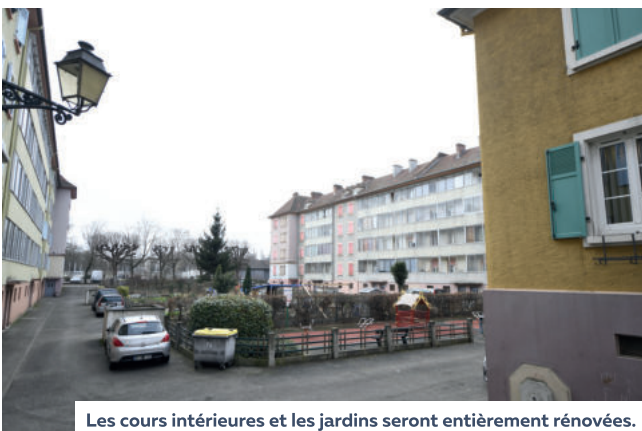
Les cours intérieures et les jardins seront entièrement rénovés.