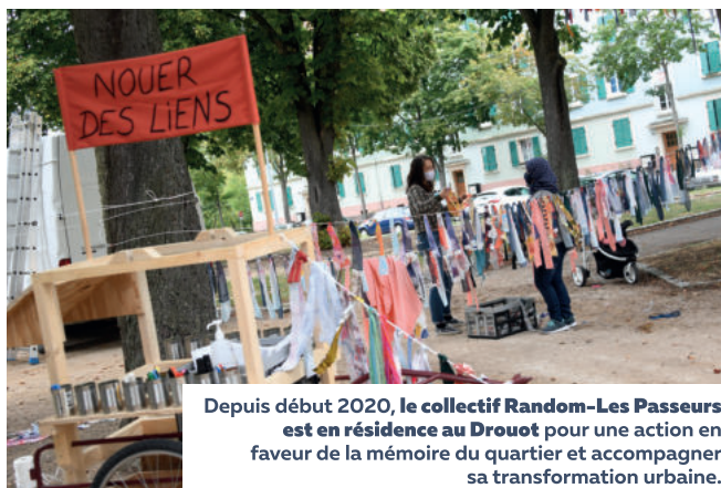
Depuis début 2020, le collectif Random-Les Passeurs est en résidence au Drouot pour une action en faveur de la mémoire du quartier et accompagner sa transformation urbaine.

Favoriser l'épanouissement et le bien-être de tous , associer les habitants à la concrétisation des projets en recueillant leurs avis et en soutenant leurs initiatives