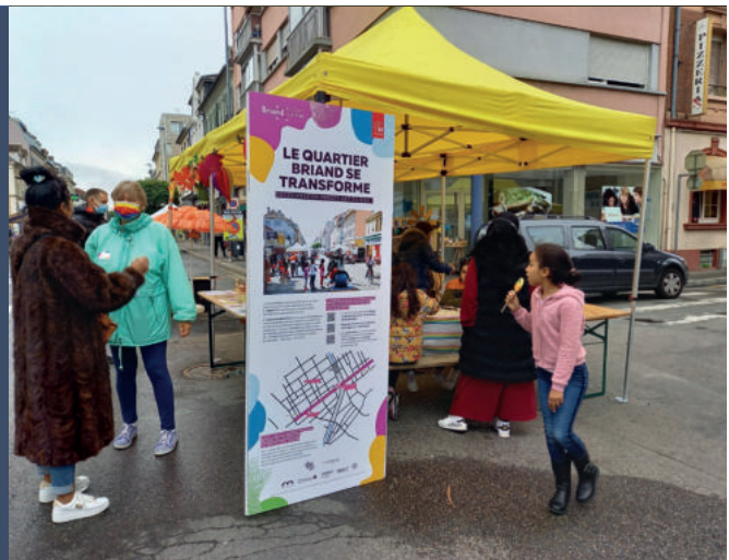
Un projet innovant pour l'avenue Aristide Briand : créer une dynamique au bénéfice de l'emploi des habitants, favoriser les relations entre eux, réaménager et apaiser la circulation... Tout cela c'est le projet Briand !