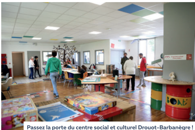
Passez la porte du centre social et culturel Drouot-Barbanègre !