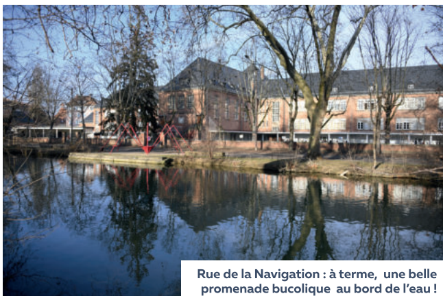
Rue de la Navigation : à terme, une belle promenade bucolique au bord de l'eau !

Pour favoriser les déplacements à pied et à vélo, les berges du canal de jonction qui relie le canal Rhin-Rhône et le Nouveau Bassin seront entièrement valorisées pour profiter pleinement de l'eau , de la nature et d'îlots de fraîcheur en ville.