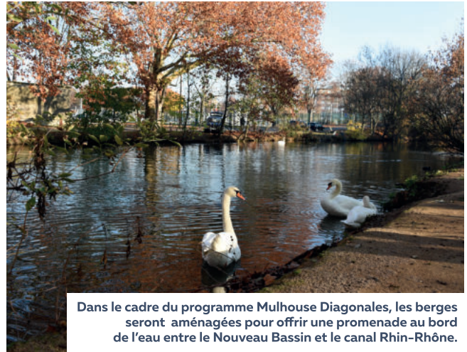
Dans le cadre du programme Mulhouse Diagonales, les berges seront aménagées pour offrir une promenade au bord de l'eau entre le Nouveau Bassin et le canal Rhin-Rhône.