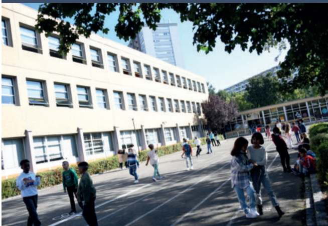
Le renouvellement urbain aux Coteaux , c'est notamment la construction de 3 nouveaux groupes scolaires et de nouveaux équipements publics.