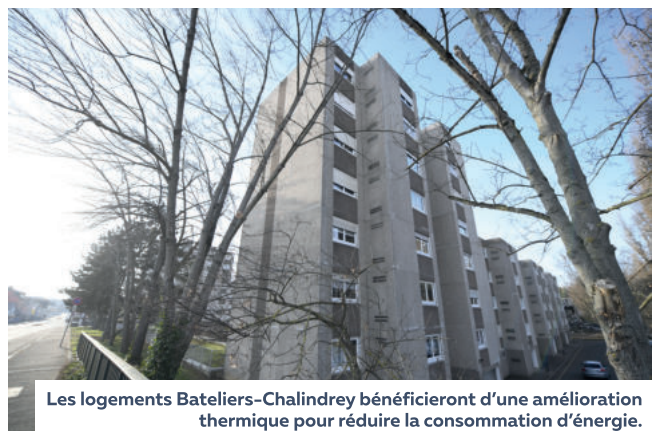
Les logements Bateliers-Chalindrey bénéficieront d'une amélioration thermique pour réduire la consommation d'énergie.