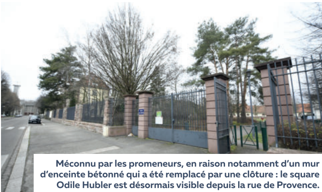
Méconnu par les promeneurs, en raison notamment d'un mur d'enceinte bétonné qui a été remplacé par une clôture : le square Odile Hubler est désormais visible depuis la rue de Provence.