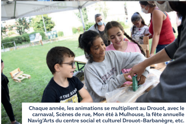
Chaque année, les animations se multiplient au Drouot, avec le carnaval, Scènes de rue, Mon été à Mulhouse, la fête annuelle Navig'Arts du centre social et culturel Drouot-Barbanègre, etc.