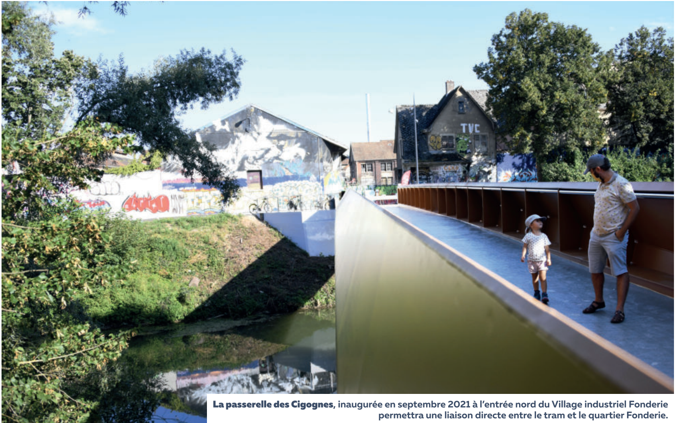
La passerelle des Cigognes , inaugurée en septembre 2021 à l'entrée nord du Village industriel Fonderie permettra une liaison directe entre le tram et le quartier Fonderie.